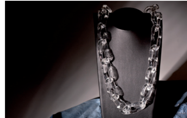
Cobra catene senza confini free chain