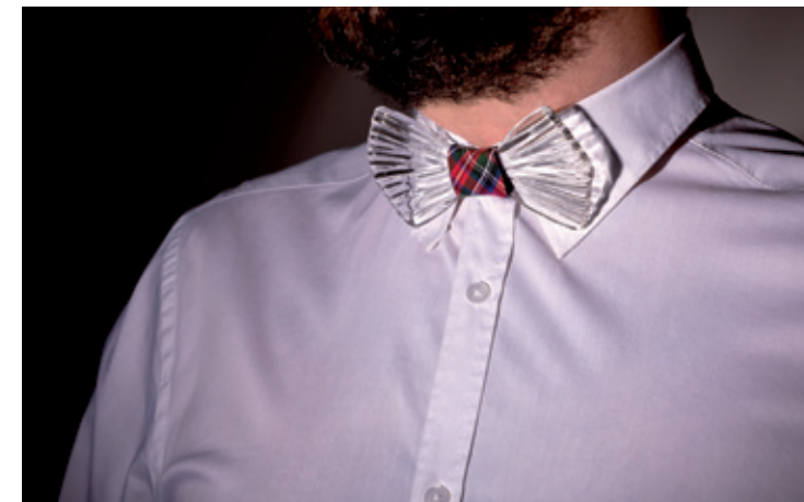
Mariposa eccentriche trasparenze eccentric transparency