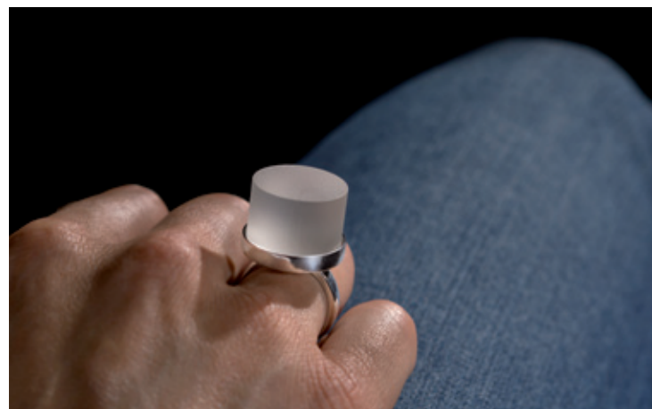
Cosmo quando la semplicità incontra la perfezione when simplicity meets perfection