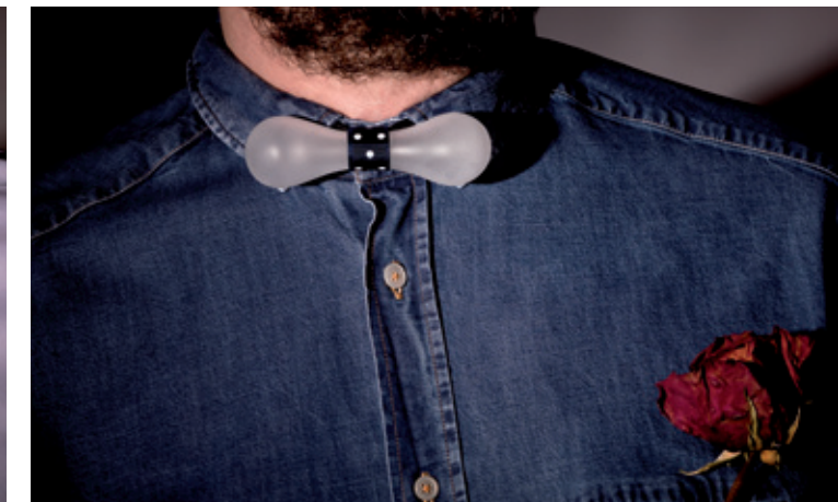
Bone eccentriche trasparenze eccentric transparency