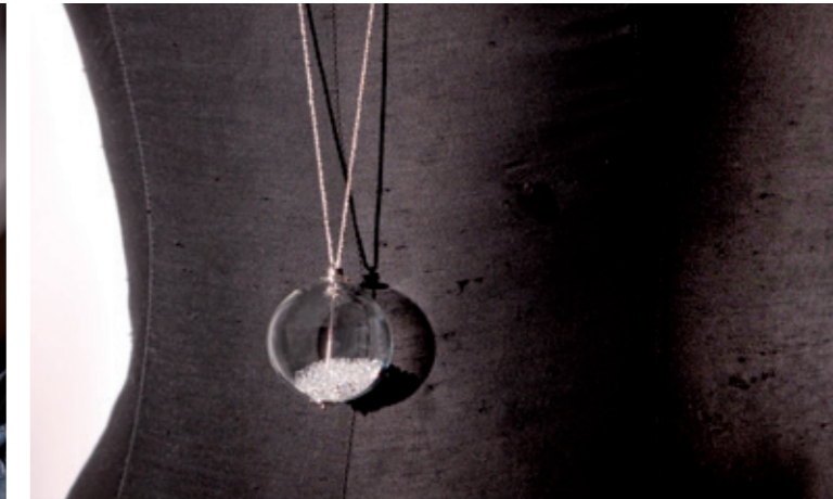
Sidney la stella più lontana the farthest star