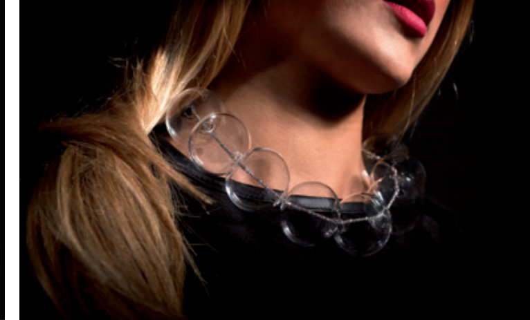
Pearl big sogni di vetro glass dreams