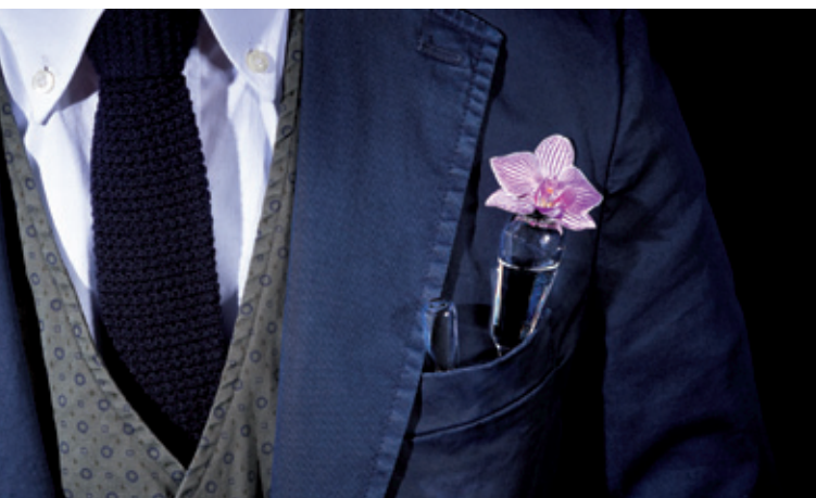
Freak stravaganza chic chic eccentricity