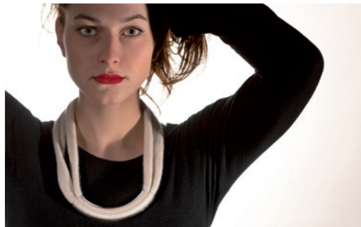
Tube curve di vetro glass bends