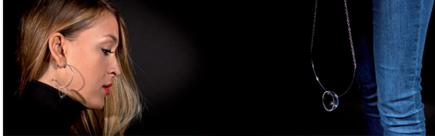
Rugiada gocce del mattino morning drops