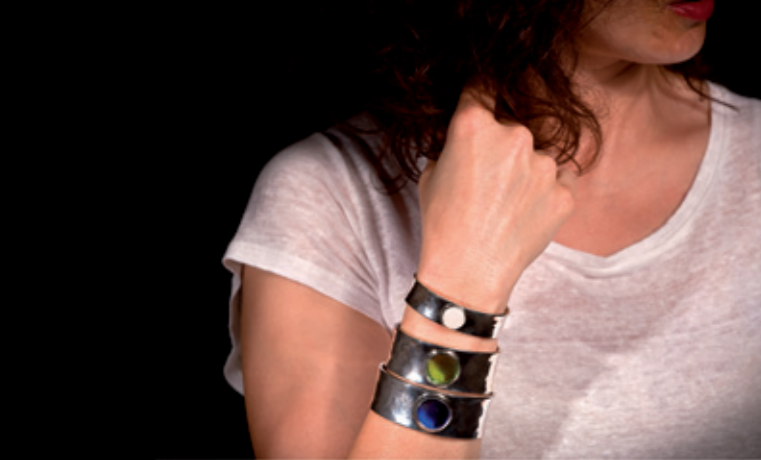
Olimpia la grande bellezza the great beauty