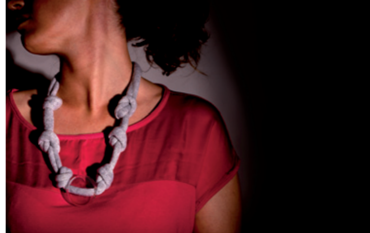
Penelope sfere di lana wool balls