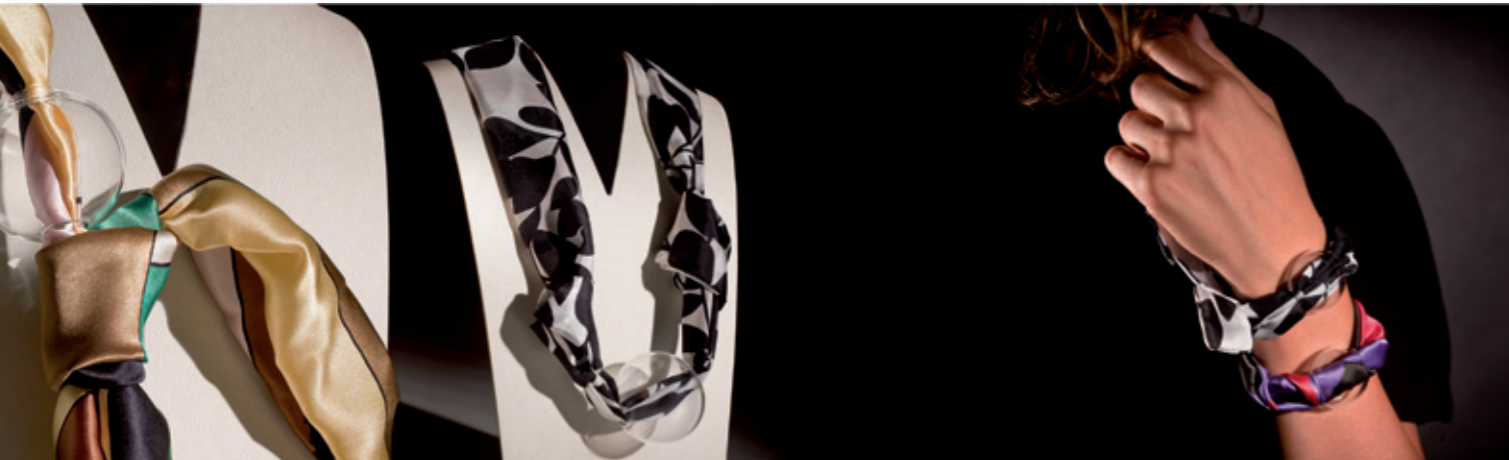
Sigalia sfere di seta silk balls